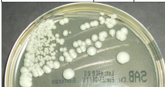
Candida albicans ATCC 10231